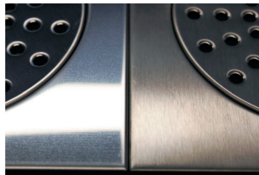
Kirkas / Matta